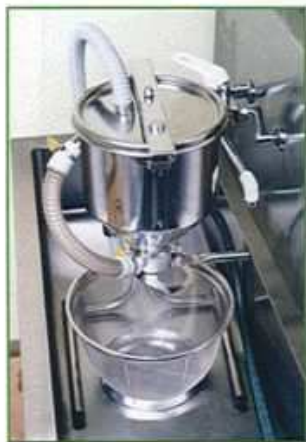
流し台の中で使用 (ザルはオプションです)