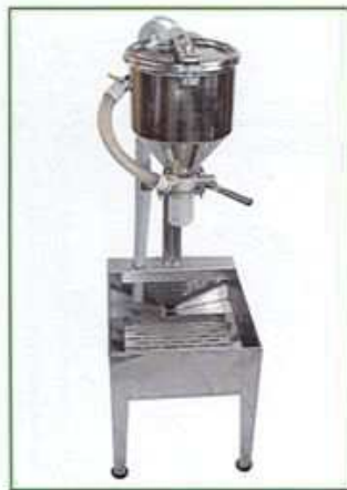
シンプル設計でお手入れも簡単 専用架台付(オプション)